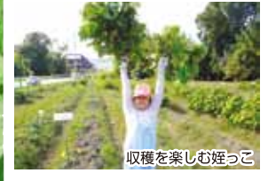
収穫を楽しむ姪っこ

この秋、初めて黒豆枝豆の収穫体験に家族で参加して来ました。異常気象で他の野菜が不作だった中、収穫した黒豆には粒の大きな豆がしっかりと入っていて、一生懸命に豆を育てて下さった農家の方たちに感謝しつつ、美味しく頂きました。