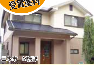
三木市 M様邸 リフォームローンのご利用例(150万円の場合) 月々均等払い ¥16,500×120回